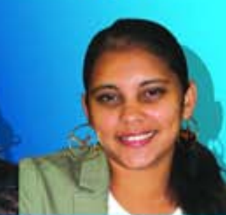
Elaine Marketing Executive